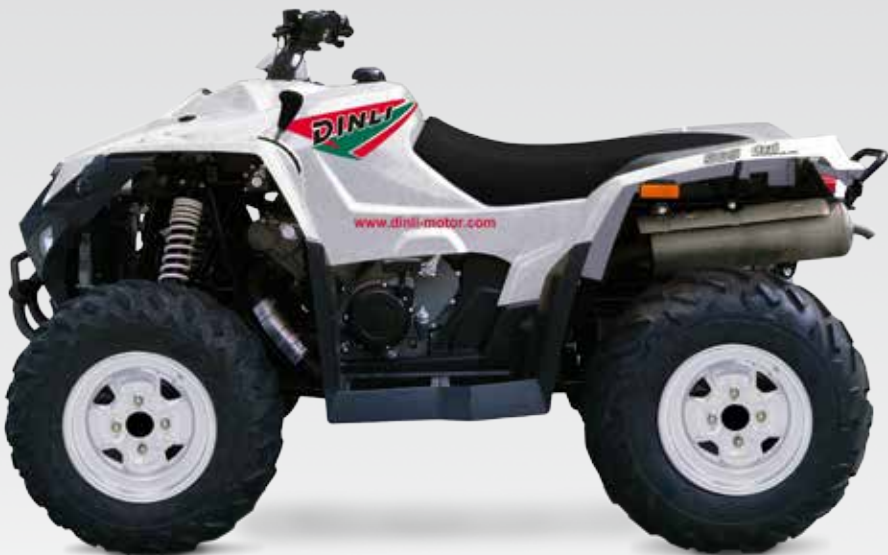
WEISS GRÜN ROT L.O.F.