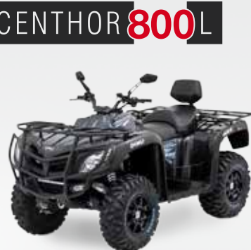
CENTHOR 800 L