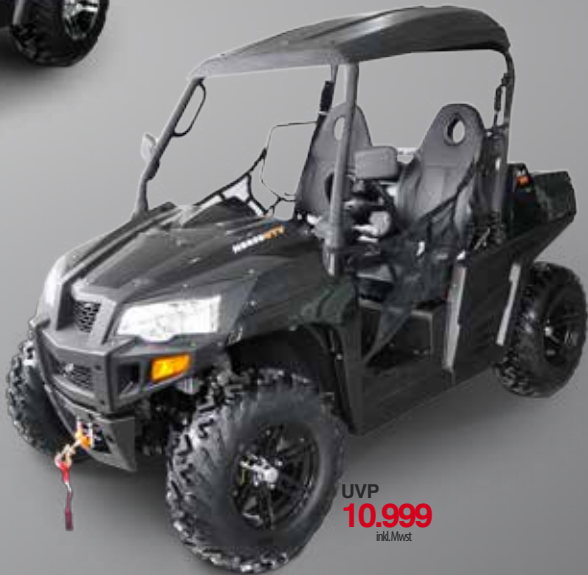
UTV 800 V2 EFI