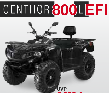
CENTHOR 800 L EFI