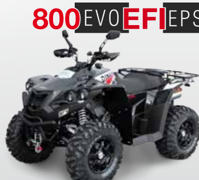
800 EVO EFI EPS