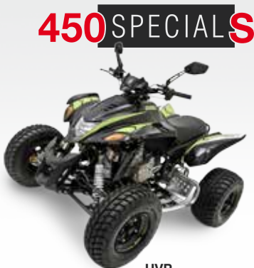
450 SPECIAL S