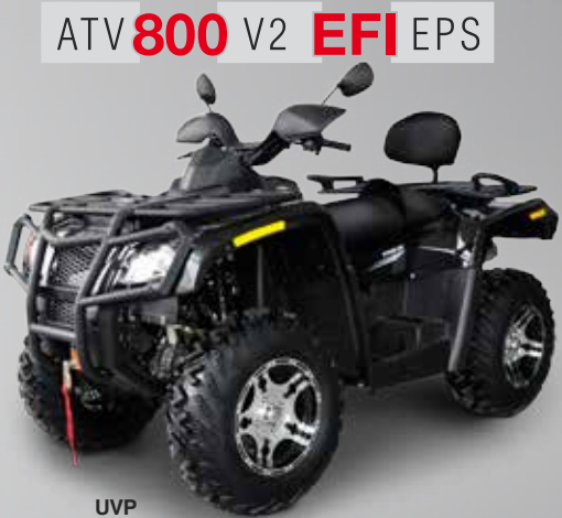
ATV 800 V2 EFI EPS