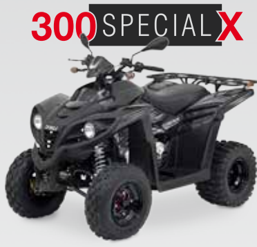
300 SPECIAL X